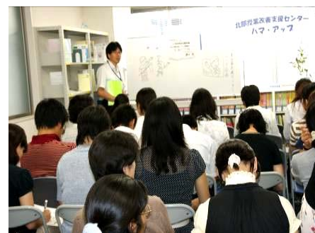
初日(27日)の講座の様子

～受講者の感想から～冊子を読むだけでは分からないことだらけでしたが、今回参加して本当に良かったと思います。ありがとうございました。北部ハマ・アップのオープンも後輩たちに宣伝し、私自身も利用し、学校生活に積極的に生かしていこうと思います。