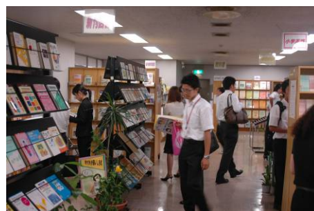
充実した教育図書