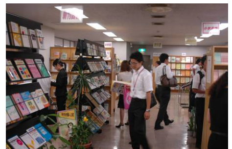
充実した教育図書